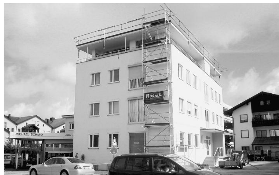
Die innovative Einhängetechnik der Firma Simon kommt völlig ohne Gewichte auf der Dachfläche aus und erlaubt so, barrierefrei zu arbeiten.