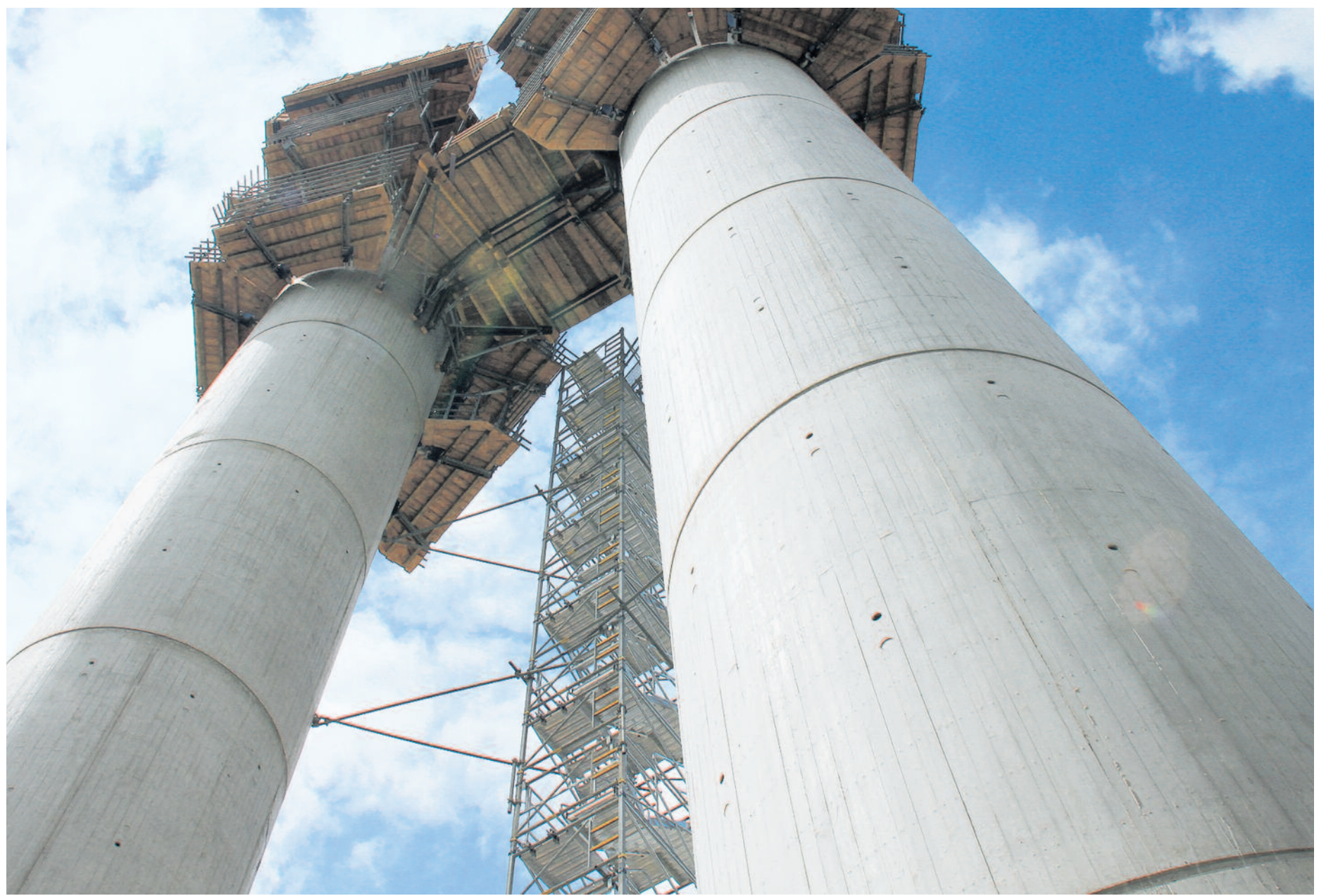
Turmhöhen von bis zu 100 m sind mit dem Treppenturm von Doka problemlos realisierbar.

Um ihren Auftraggebern höchstmöglichen Komfort und Sicherheit gewährleisten zu können, bietet das Unternehmen darüber hinaus einen eigenen Montageservice.