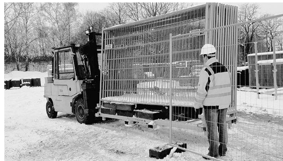
Auf der Kombipalette haben sowohl Zaun als auch Füße des Absperrsystems Platz, womit bei Transport, Lagerung, Auf- und Abbau erheblich Zeit und Kosten gespart werden können.

Die speziell entwickelten Kombipaletten der HMR für den Transport und die Lagerung von Baustellenzäunen/Absturzsicherungen aus Kunststoff oder Stahl und den Paletten für Stahlgitter können durch die praktische Handhabung täglich Kosten eingespart werden. Bei der Entwicklung wurde größter Wert auf Haltbarkeit, Mobilität und Robustheit gelegt, wodurch es auch auf lange Sicht gesehen Kosten eingespart werden sollen. Die Kombipaletten Systeme sind auf das jeweilige Absperrmaterial zugeschnitten, sodass Transport-, und Lagerplatz optimal ausgenutzt werden. Alle Kombipaletten Systeme können dabei übereinander gestellt werden, auch wenn unter dem Absperrmaterial die notwendigen Füße liegen. Oft könne dadurch ein ganzer Lkw-Transport eingespart werden. Da die Paletten mit einem Bagger entladen werden können, ist es