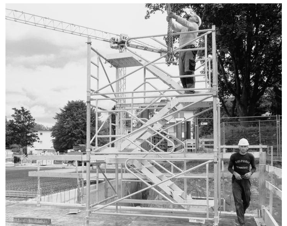
Für die Montage werden lediglich zwei Mann benötigt. Die erforderlichen Einzelteile können günstig angemietet werden.

festigung erfolgt per Konusschraube und Universal-Kletterkonus beziehungsweise zwei 16er- oder 18er-Dübeln. Die Anzahl der Befestigungen ist abhängig von der Höhe des Treppenturmes. Bis 40 m Höhe sind die Verankerungen in jedem fünften Schuss, also lediglich alle 6,00 m vorzunehmen.